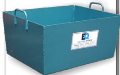
MASSEIRA METÁLICA - 50 litros