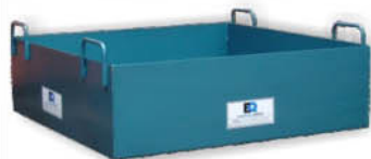
MASSEIRA METÁLICA 1.00X1.00X0.30m