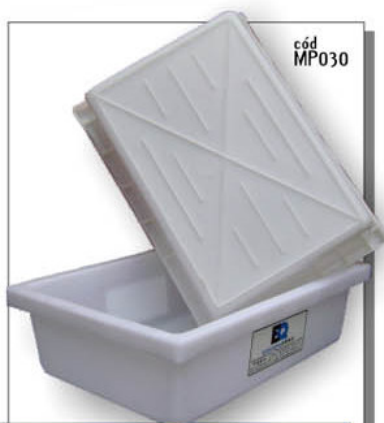
MASSEIRA EM PVC - 30 litros