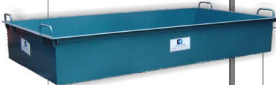
MASSEIRA METÁLICA 2.00X1.00X0.30m